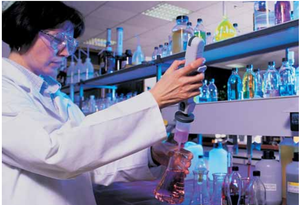
Tests zur Neuzulassung von Medikamenten werden aktuell heftig diskutiert.