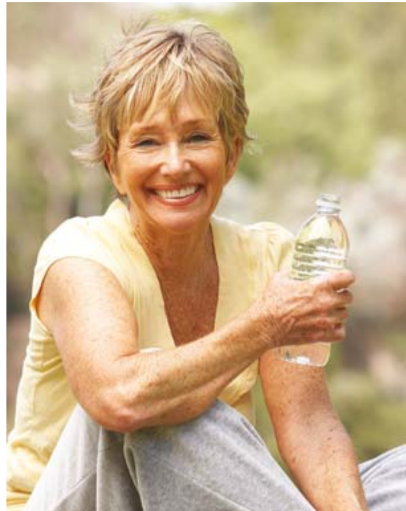
„Ich spüre, dieses Wasser tut mir gut!“

objektive Herz- und Kreislauf-Parameter auf. So treten evtl. vorhandene Müdigkeitsgefühle zurück, Abgeschlagenheit und Kopfschmerzen reduzieren sich und im EKG zeigen sich oft positive Effekte. Daneben wird von einer Verbesserung der Energiebilanz berichtet und von einer deutlichen generellen Revitalisierung. Zusammenfassend werden weitere Wirkungen des Sauerstoffwassers in der Literatur berichtet: