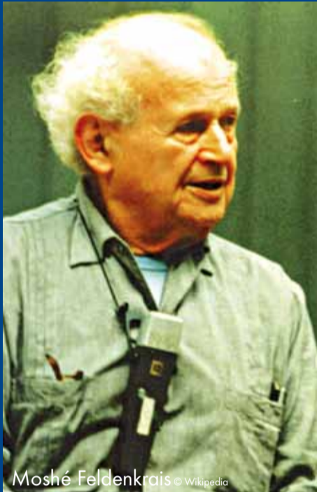
Moshé Feldenkrais

Wenn Sie den Wunsch haben, etwas in Ihrem Leben zu verändern, etwas für Ihre Beweglichkeit und das Wohlbefinden zu unternehmen, Ihre Leistungsfähigkeit und Ausdauer zu stärken oder wenn Sie Schmerzen verspüren, sich gestresst und verspannt fühlen, dann könnte die Feldenkrais-Methode für Sie ein richtiger Weg sein.