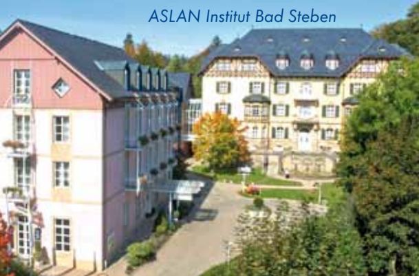
ASLAN Institut Bad Steben

13 Behandlungstage 800 € p.P. 20 Behandlungstage 1.125 € p.P.