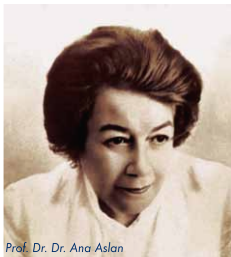
Prof. Dr. Dr. Ana Aslan

Ana Aslan entdeckte, dass eine spezielle, in der Natur nicht vorhandene vitaminartige Substanz Zellstoffwechselblockaden lösen kann, wenn sie in definierter Aufbereitung und Dosierung injiziert wird. Diese Entdeckung ließ die medizinische Fachwelt aufhorchen. Renommierte Universitäten weltweit luden sie zu Vorträgen ein. Für ihre Arbeiten erhielt Ana Aslan zahlreiche internationale Auszeichnungen, wissenschaftliche Ehrentitel und Staatsorden.